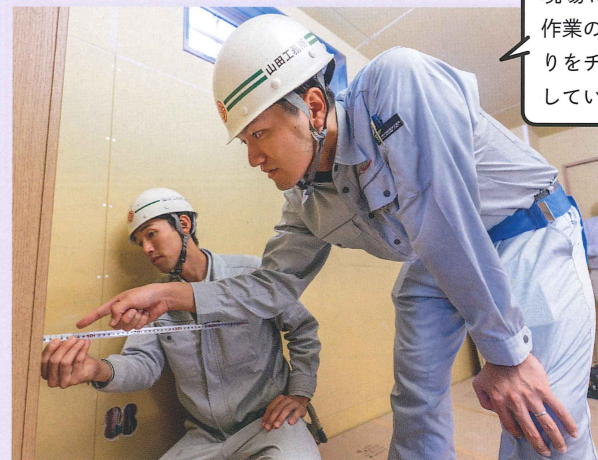
現場に入り、作業の仕上がりをチェックしていく。