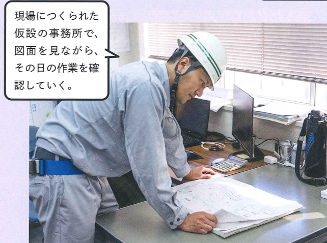
現場につくられた仮設の事務所で、図面を見ながら、その日の作業を確認していく。