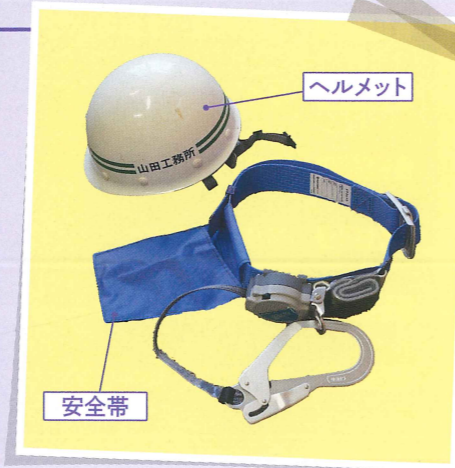
建築現場に行くときは、ヘルメットと、高いところに登る時の命綱となる安全帯もっていく。