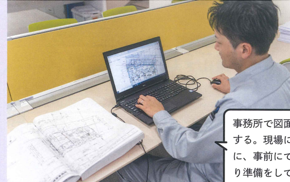
事務所で図面を確認する。現場に入る前に、事前にできる限り準備しておくことが大切。

また、騒音・振動・産業廃棄物に対する環境管理も私の仕事です。音の出る作業などは防音シートを使って、騒音を極力減らし、近隣の方に迷惑をかけないようにする、ランチの時間帯は作業を止めるなどの配慮をしながら、環境に対して対策をしています。もちろん、着工前に近隣の方にごあいさつをしに行くことも大事な仕事です。